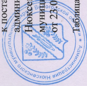
Таблица 1 к муниципальной программе

муниципального округа от 23.05.2024 № 176